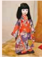
飛騨山静恵 (富山市)