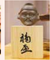
南部 祥雲 (高岡市)