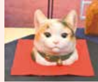
高畠 彩乃 (射水市)