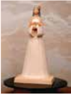
笹波 美恵 (高岡市)