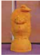
牛島 辰馬 (南砺市)